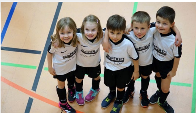
Unsere Mannschaft beim Hallenturnier in Blaufelden.

Momentan besuchen 12 bis 17 SpielerInnen das Training, welches immer montags von 17.30 Uhr bis 18.30 Uhr stattfindet. In den Wintermonaten trainieren wir in der Turnhalle in Hengstfeld und im Sommer sind wir auf dem Sportplatz.