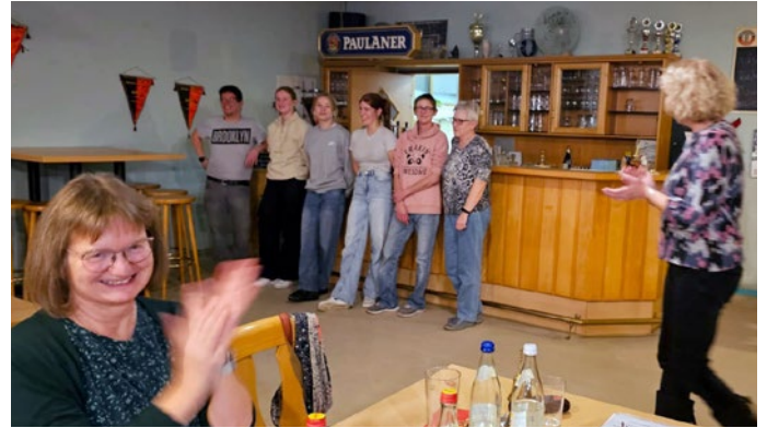
Applaus für unser Wirtschaftsteam von den Landfrauen.

Die Bewirtung erfolgte in Zusammenarbeit mit den Jugendlichen ähnlich wie in einer Jugendherberge. Das hat zur vollsten Zufriedenheit auf beiden Seiten funktioniert.