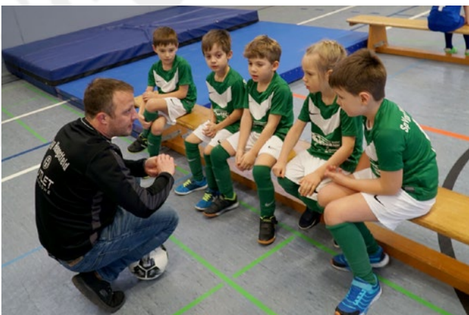
Letzte Anweisungen vor dem Einsatz in Gerabronn.

Mittlerweile haben wir zwei von vier Hallenturnieren (Blaufelden und Gerabronn) erfolgreich bestritten. Nach großem Einsatz und viel Freude bei den Spielen, durften alle einen Pokal mit nach Hause nehmen. Im Frühjahr findet wie jedes Jahr eine G-Jugend-Schnupperfeldrunde statt, zu der wir zwei Mannschaften anmelden werden. Zusätzlich sind im Sommer noch einige Feldturniere bei verschiedenen Sportveranstaltungen geplant.